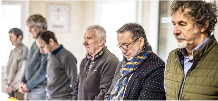
«Le Bas-Armagnac club cyclo» se prépare au passage du Tour de France

Qui fera étape mardi 4 juillet 2023 sur le circuit de Nogaro