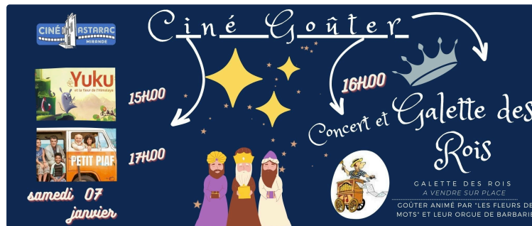
Concert et Galette des rois

De la guitare de Yuku la souris, en passant par l'orgue de barbarie de « Les fleurs de mots » jusqu'aux airs créoles et la voix délicieuse du " Petit Piaf", la nouvelle année se célèbre en musique au Ciné Astarac de Mirande.