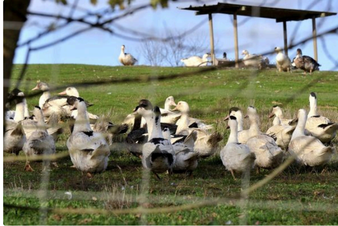
La préfecture communique au sujet de la situation de l'influenza aviaire au 6 janvier 2023

Un quatrième foyer d'influenza aviaire hautement pathogène a été confirmé dans un élevage de canards à COULOUME-MONDEBAT, commune limitrophe au sud de la commune d'AIGNAN touchée par les trois premiers foyers.