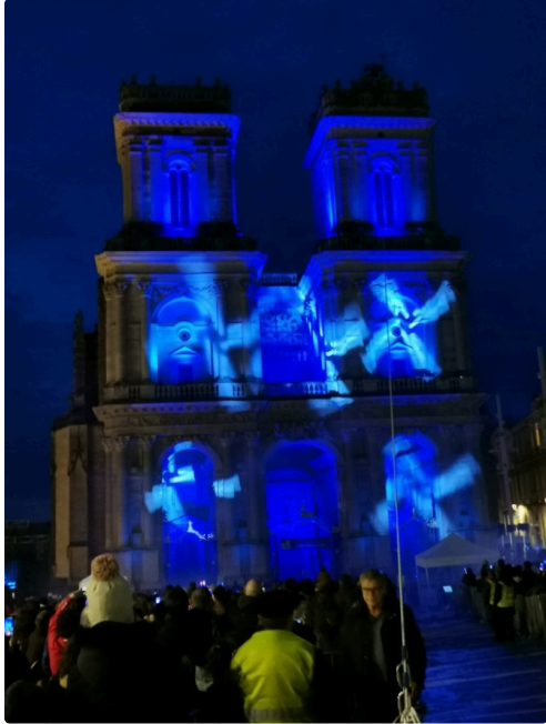
Avant l'arrivée de la Befana, magnifique son et