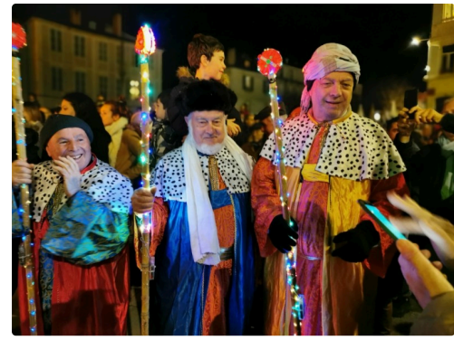
les rois mages