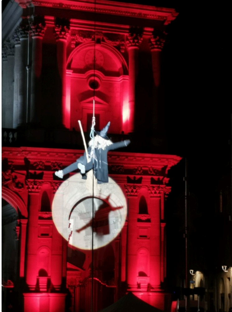
La fête de la Befana a enchanté petits et grands

Samedi soir sous un ciel idéal et les regards admiratifs d'une foule dense a eu lieu l'accueil de la Befana, gentille sorcière italienne .