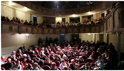
Un théâtre bondé