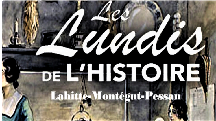
Ce soir : la mort de Raspoutine

Deuxième soirée consacrée à l'histoire russe : il sera question ce soir de la vie et de la mort de Raspoutine : son enfance, sa conversion à la religion, ses relations avec le tsar Nicolas II et Alexandra dont il guérit plusieurs fois leur fils Alexis, son influence sur la famille royale et la politique, l'aversion de Kototzov à son égard, sa mort complétée par le prince Youssoupov et rehaussée par des membres de la famille impériale.