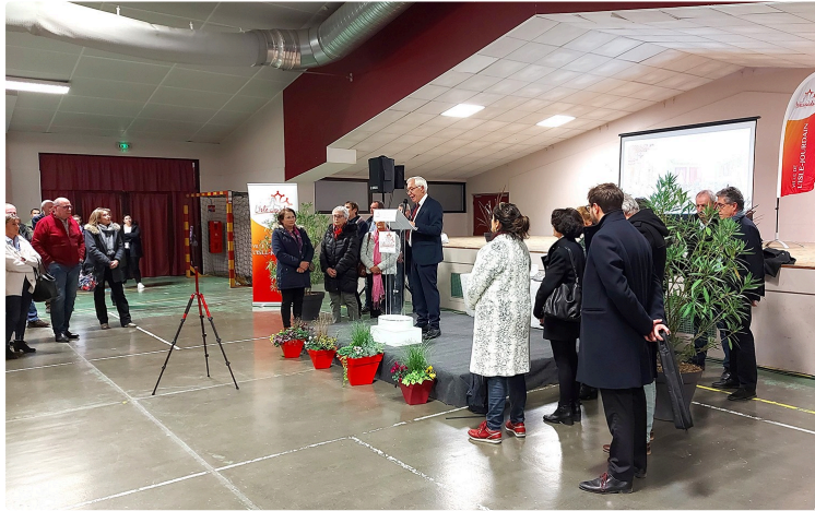
Voeux du maire Francis Idrac aux Lislois et Lisloises.