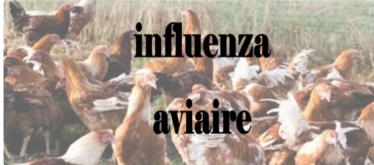
Influenza aviaire, un onzième foyer confirmé dans le Gers

Un nouveau foyer (le onzième dans le département) a été confirmé le 22 janvier par le Laboratoire National de Référence sur un élevage de la commune de AYZIEU et dépeuplé préventivement le 21 janvier. Par ailleurs une nouvelle suspicion est en cours aujourd'hui dans un élevage de poulets sur la commune de EAUZE. Le préfet du Gers a pris un arrêté redéfinissant, autour de cette suspicion une zone réglementée temporaire de 10 km bloquant les mouvements des oiseaux.