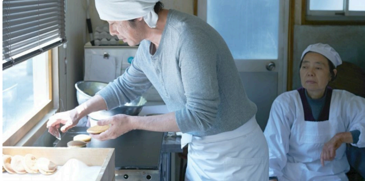
Littérature et gastronomie avec Les Mots d'Hiver, c'est ce week-end !