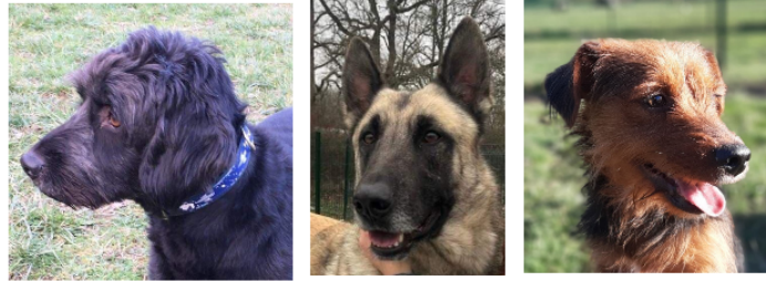
Les trois "garçons" de la semaine !

Cette semaine, la SPA vous présente trois adorables loulous qui viennent d'arriver au refuge et ont hâte de trouver un foyer aimant.