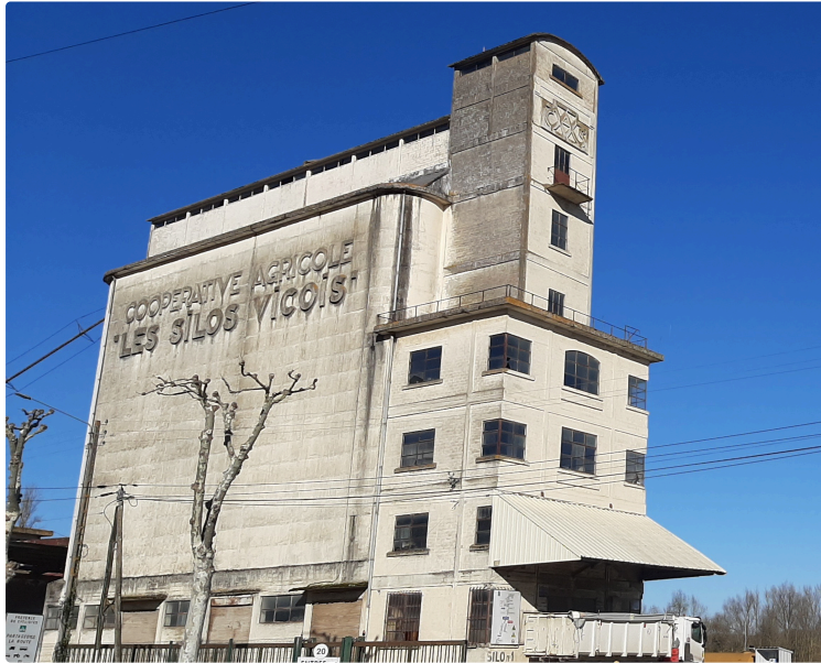
Retour sur l'histoire des Silos Vicois...avant qu'on ne nous les prenne...

A la sortie de Vic-Fezensac, de part et d'autre de la route de Mouchan, s'élèvent deux bâtiments agricoles emblématiques de Vic-Fezensac : la cave viticole et les silos.