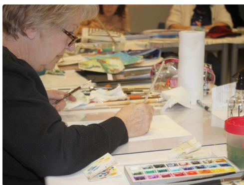
31 01 2023 atelier aquarelle PAVIE.JPG