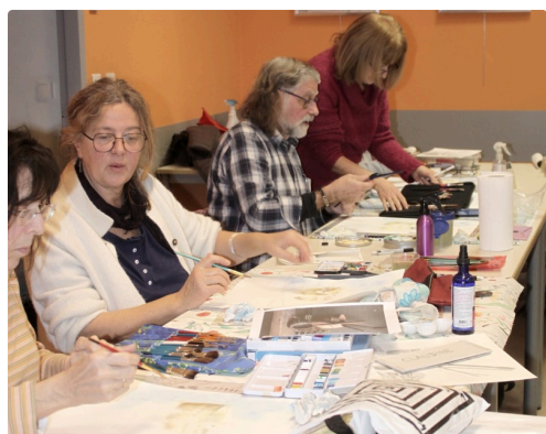
31 01 2023 atelier aquarelle 2 PAVIE.JPG