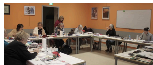
31 01 2023 atelier aquarelle 4 PAVIE.JPG