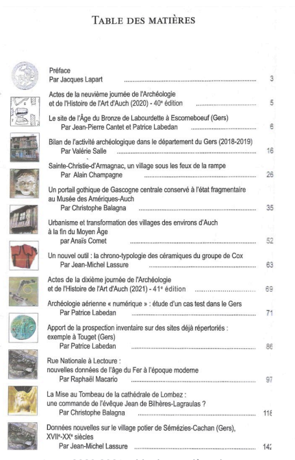
Actes 2020 2021 table des matières.jpg