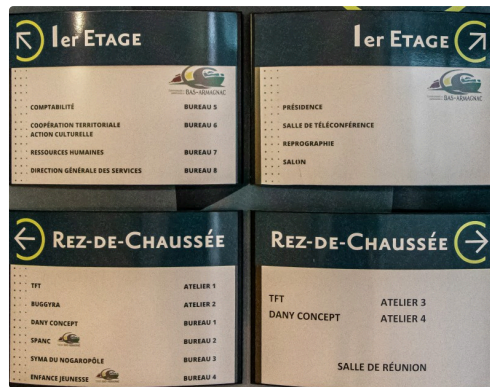
Panneau d'orientation commun pépinière - CCBA