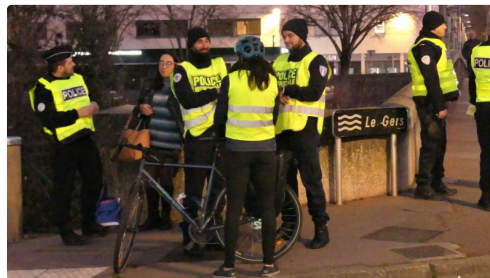
Toujours de la bonne humeur.