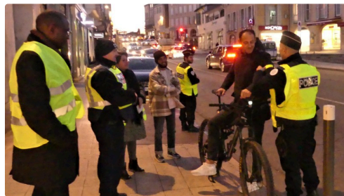
Super un brassard réfléchissant en cadeau.