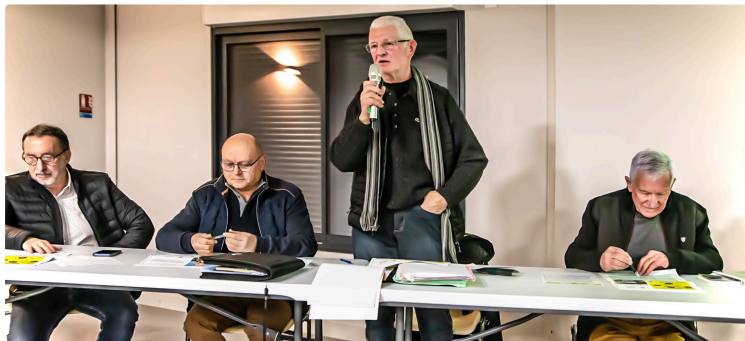
Le rêve du Tour de France devient réalité à Nogaro