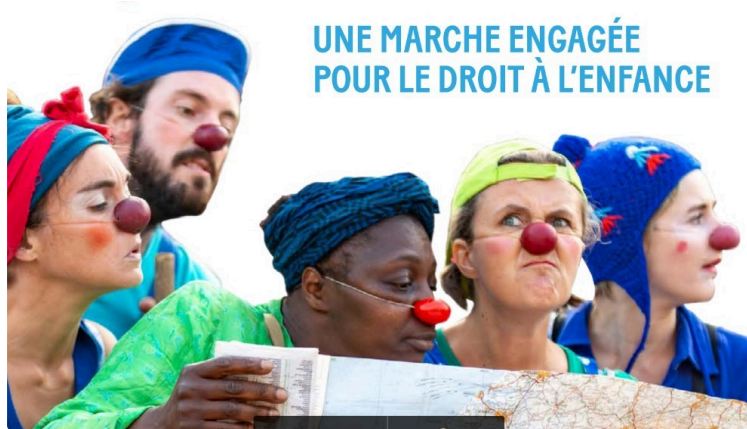
Le Gers , scène privilégiée par "LA MARCHÉ DES NEZ"