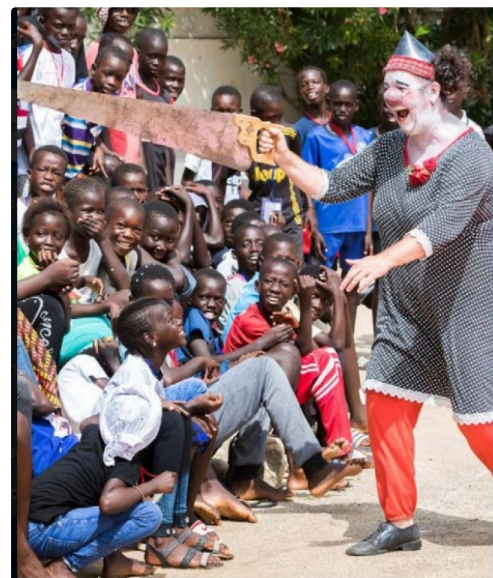
Clowns sans frontière au Sénégal avec les enfants des rues