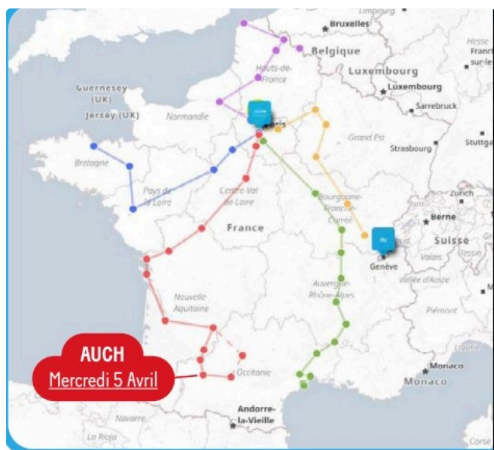
Les cinq itinéraires au départ de Toulouse, st Brieuc, Sète, Lons-le-Saunier et Calais

Une information plus complète sur le déroulé de la manifestation sera publié fin mars / début avril