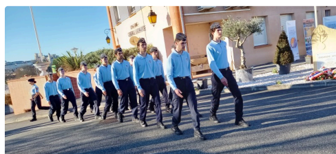
Arrivée des Cadets.