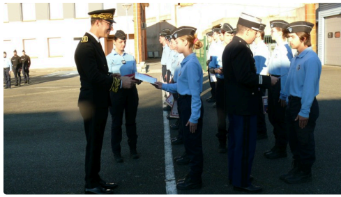
Remise des diplômes