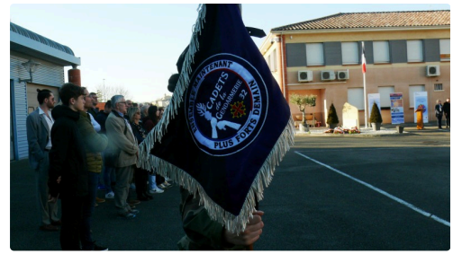
Drapeau des Cades de la gendarmerie du Gers