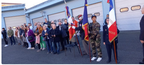
Les parents étaient aussi présents