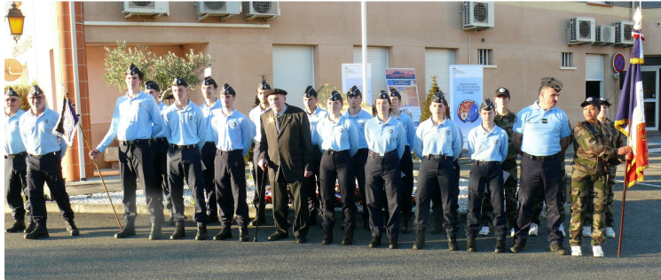
Les Cadets de la gendarmerie du Gers ont reçu leurs diplômes

La deuxième promotion des Cadets aura pour parrain "Gendarme Lacaze"