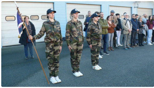
Trois Cadets de la première promotion.