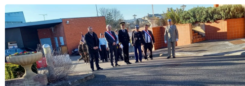
Arrivée des officiels

Mort pour la France, ce jeune héros et martyr de la Résistance sera décoré de la Médaille militaire à titre posthume et cité en exemple par le représentant de l'Etat lors d'une cérémonie officielle en 1946 avec pose d'une plaque commémorative dans les locaux de la brigade de gendarmerie de Mirande.