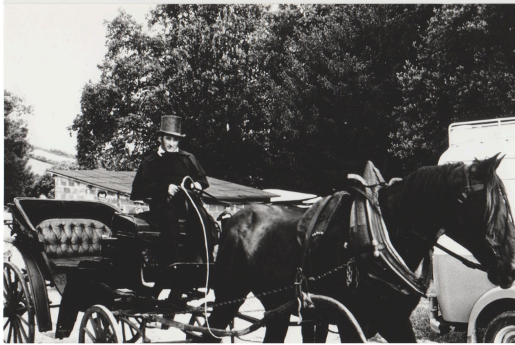
Riguepeu 1843 : l'affaire de la prétendue empoisonneuse, la veuve Lacoste