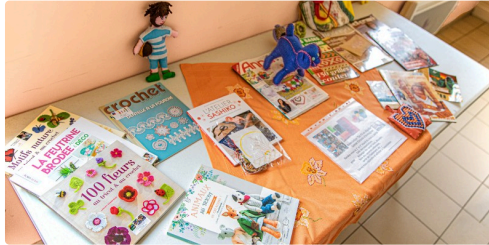
Toute une bibliothèque de modèles