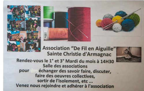
L'affiche de l'association