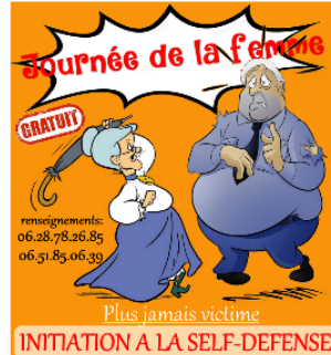
Journée de la femme : initiation à la self défense avec les Arts Martiaux Vicois

Les Arts Martiaux Vicois organisent une initiation gratuite à la self-défense dans le cadre de la journée internationale des droits de la femme qui a lieu le 8 mars