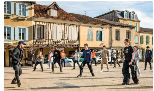
Apprentissage des gestes de base de l'escrime