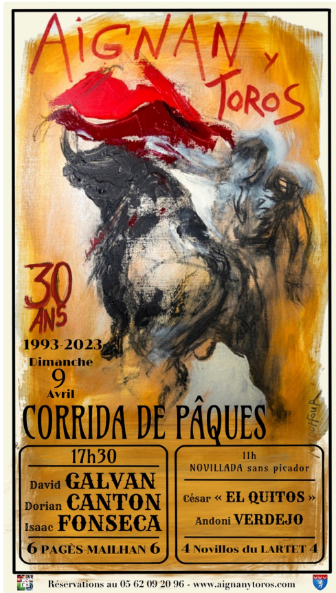
L'affiche d'Yves Duffour