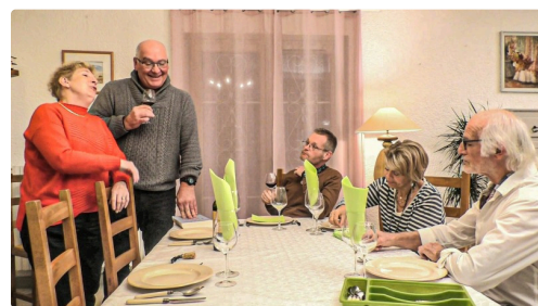
Scène de famille

N.B. - Toutes les photos ont été communiquées par Gilles Dréanic. Sur la photo du haut de page, les sapeurs-pompiers emportent le cadavre.