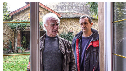
...Elle commence son enquête