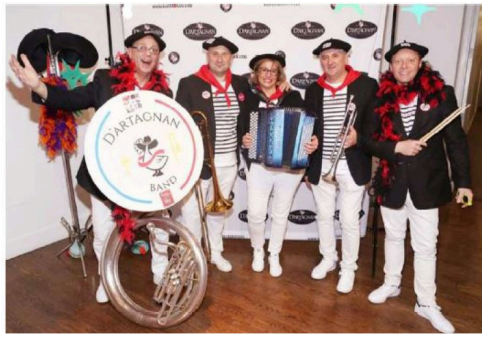
banda d artagnan.JPG