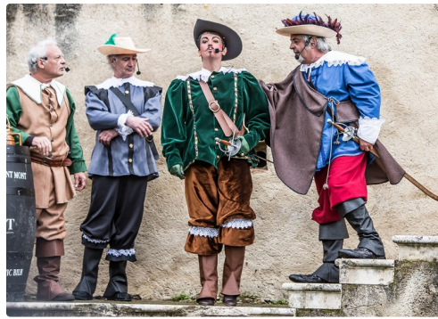
Un gentilhomme cherche querelle à Colinot du Vic-Bilh (photo Roland Houdaille en 2015)g