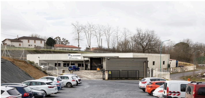
Entrée de l'usine des Établissements Schaerer