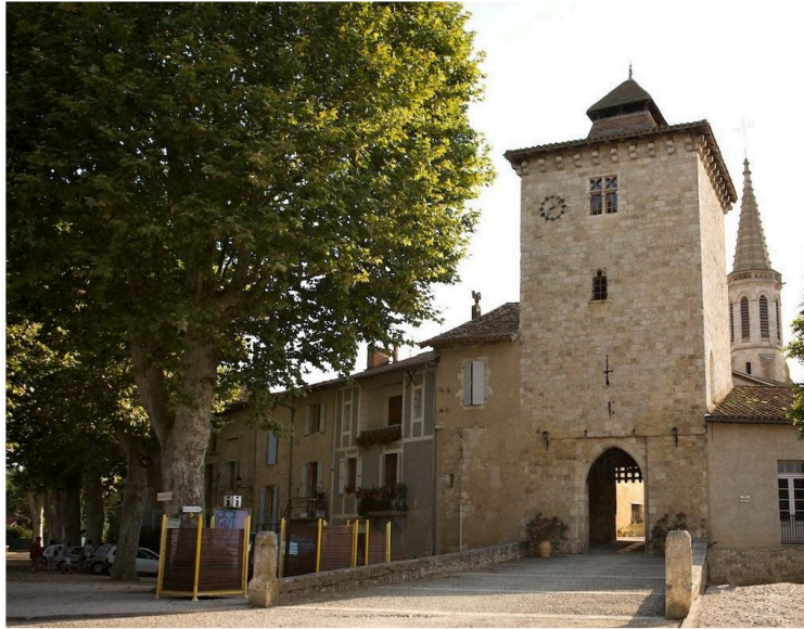
La Maison de l'illustration prépare le printemps !