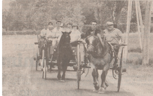
Au temps de l'hippomobile...