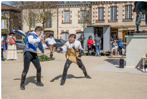
Démonstration d'escrime par "les Lames Lupiacaises"