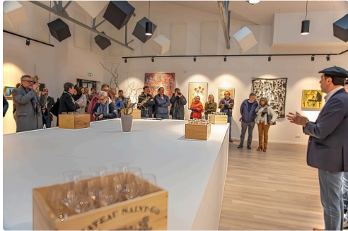
Galerie "Bleue-Plaimont" au-dessus de la boutique de la Cave de Saint-Mont