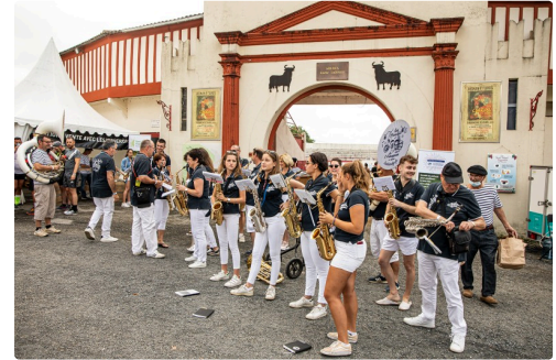
La banda "Leses Dandy's" place des Arènes à Aignan