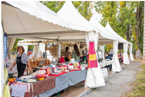
Chapiteau à Plaisance