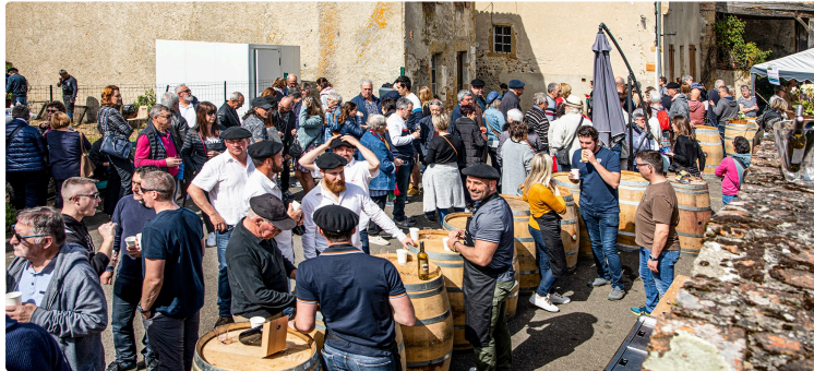
Grande fête gasconne des vins du Saint Mont: 3 jours de festivités à ne pas manquer

L'art de vivre du Sud-Ouest, culturel, œnotouristique et gastronomique