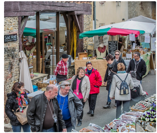
Les visiteurs déambulent dans Saint-Mont