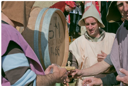
Mise en perce d'un tonneau de Faïte à Saint-Mont