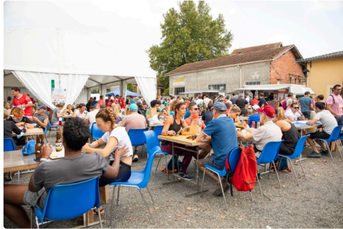
Place des arènes à Aignan