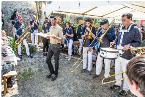
Déjeuner aux tisons et en musique à Saint-Mont