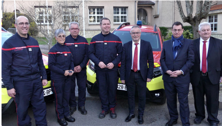
Le SDIS s'équipe pour les feux de forêt grâce au Département

Ce mardi 21 mars 2023 à 18h30 à l'Hôtel du département, Monsieur le préfet et Monsieur le président du conseil départemental du Gers accueillent les autorités ainsi que les personnels spécialisés en feux de forêts du SDIS 32 pour une réception ciblée sur deux thèmes.