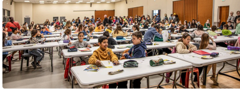
Les enfants s'installent