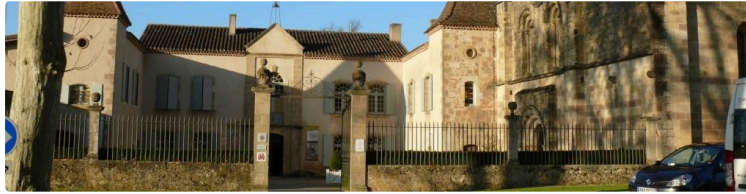
Du côté de l'abbaye de Flaran