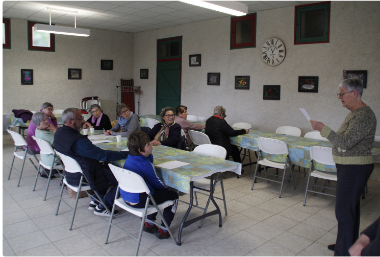
La dictée, un jeu.