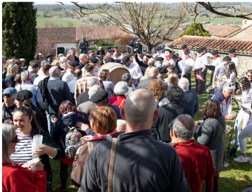
Le tonneau est assiégé