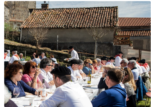
Une des nombreuses tables installées en plein air