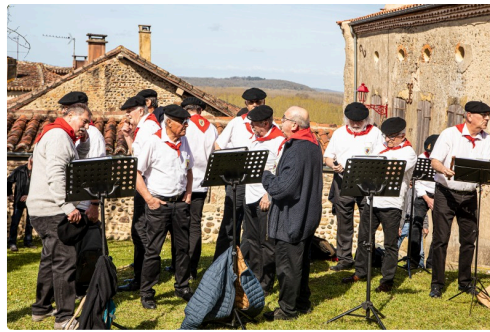
Les chanteurs vignerons du Vic-Bilh arrivent