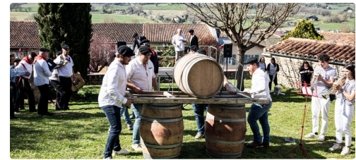
Arrivée du tonneau destiné à être mis en perce