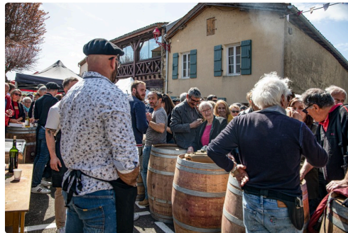
Les bars installés dans la rue sont pris d'assaut