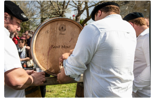
Mise en perce