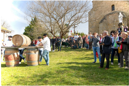
Le public sur le parvis de l'église