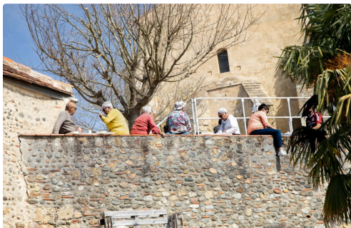
Faute de place on s'installe où l'on peut pour déjeuner