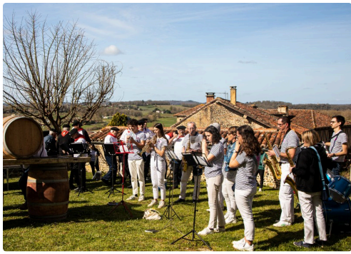
La Banda de Riscle se prépare