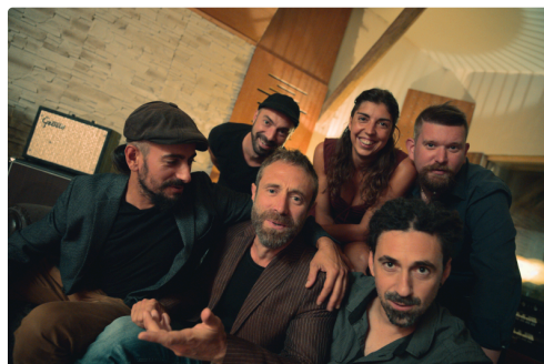
Graine se Sel.png