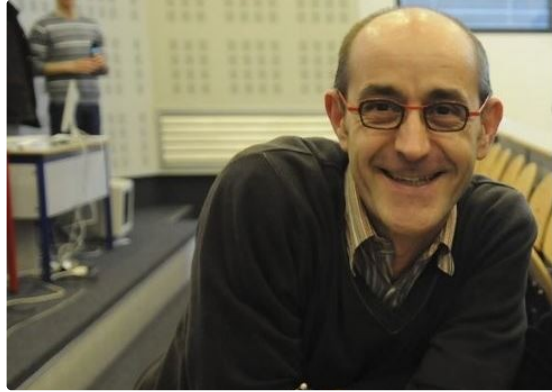
Prochain programme pour la semaine à venir de Radio Fil de l'Eau