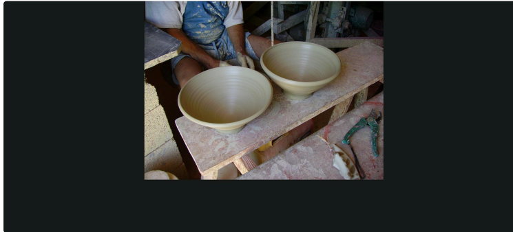
Retour du marché des potiers à Nogaro

Il y avait eu un marché des potiers à Nogaro, six fois, dans les années 1990, à ce que disent les anciens. Eh ! Bien voici le retour des potiers. C'est samedi 22 et dimanche 23 avril 2023.