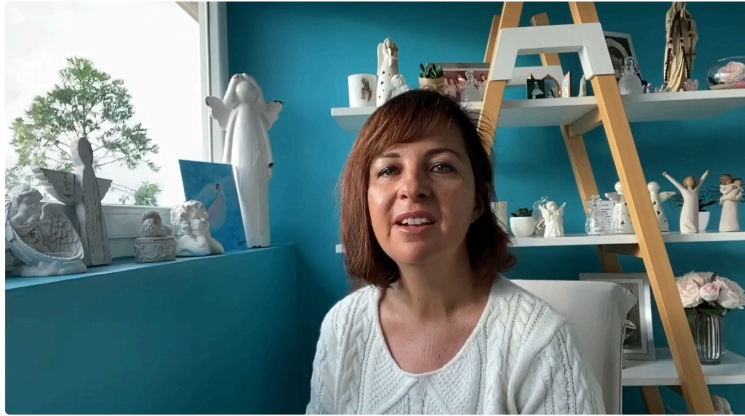
Et si la Mort n'existait pas ? Dimanche 23 avril, dernières places!