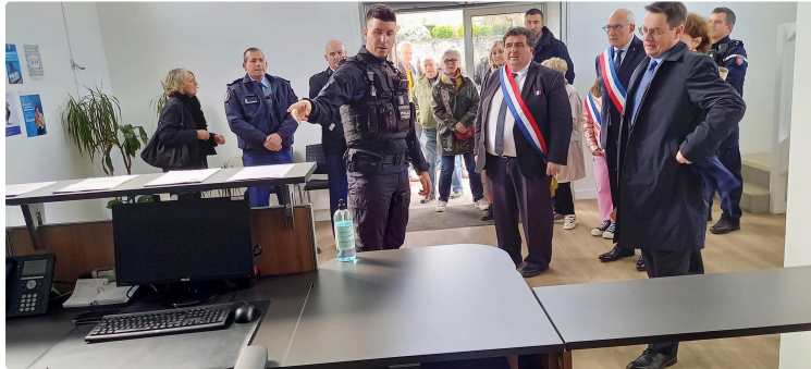
Les nouveaux locaux de la police municipale inaugurés