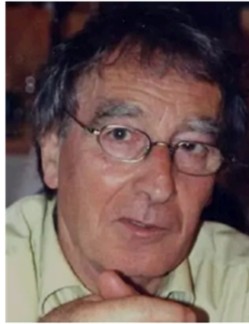
Risclé - Conférence : l'Occitanie au féminin

Risclá - conferéncia : l'Occitània au feminin