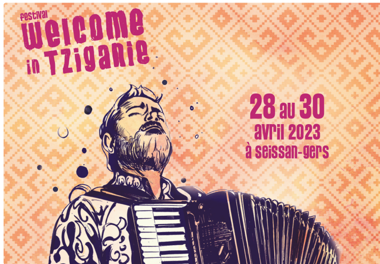
Nouveau programme pour la semaine à venir à Radio Fil de l'Eau.