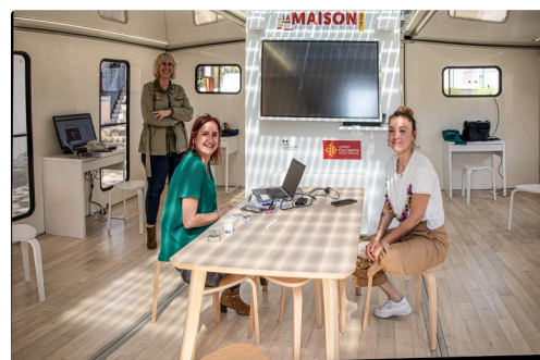
Les 3 consultantes

N.B. - Plus d'information sur la MOM : [ https://www.laregion.fr/MOM ].