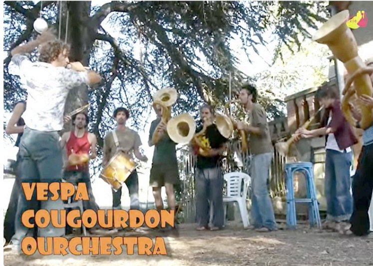
Que se passe-t-il au festival TRAD'ENVIE ?

Rendètz-vous lo 17 de Mai a 18 H 30 dens un ambient cogordesc !!« Aquò bolega deu cap aus pès