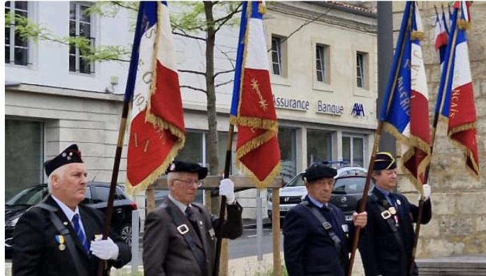
Cérémonie en hommage aux victimes et héros de la déportation.