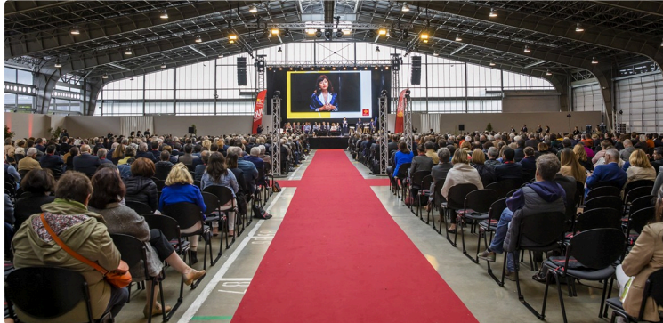
Carole Delga à la rencontre des maires de la Région