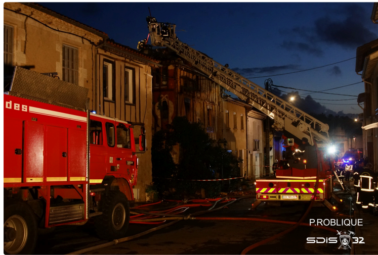
Une maison la proie des flammes