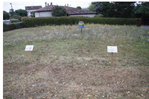
Biodiversite La Tourette 23072022 (2).JPG

Cette réalisation du personnel des espaces verts apporte sa contribution à la candidature de Miélan dans le cadre des villes et villages fleuris du Gers.