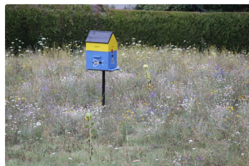
Biodiversite La Tourette 23072022 (12).JPG