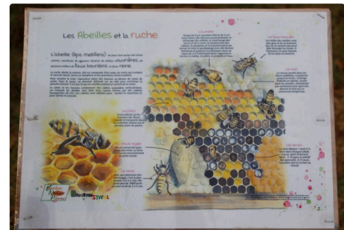
Biodiversite La Tourette 23072022 (5).JPG