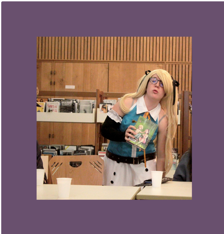
Après-midi destinée à la Bande Dessinée et au Manga: mercredi 31 mai à partir de 16h30

Suite au succès de la soirée bande dessinée et manga destinée aux grands ados et adultes le 14 avril dernier, et ayant senti un engouement de la part des plus jeunes pour ce type d'événement, la médiathèque de Pavie propose une après-midi destinée à la bande dessinée et au manga pour les 8 ans et +, le mercredi 31 mai à partir de 16h30 .