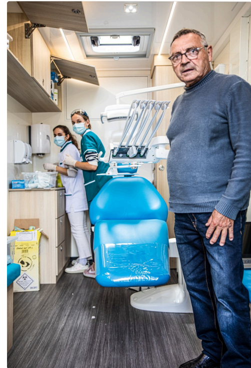
Un nouveau client entre dans le camion