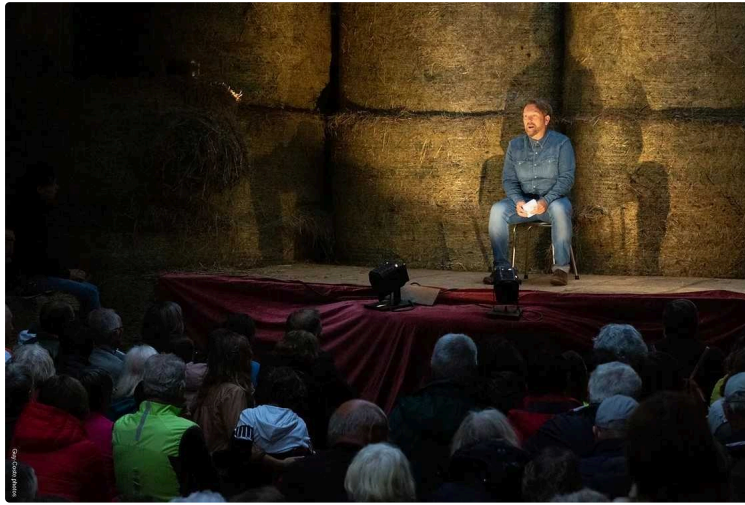
Et zou ! Site § Cap propose "Mon père avait trois vaches" un spectacle inédit joué dans des conditions insolites !