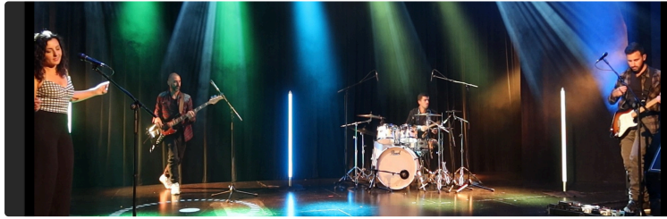
L'hôtel-restaurant Solenca (à Nogaro) lance son été musical et gastronomique